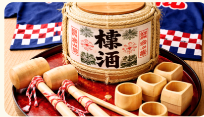
鏡開きセット(5名分) 木槌/木杓/はっぴ 22,000円(税込)