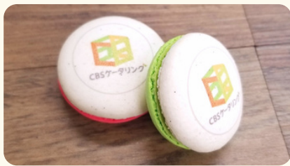
ロゴ入りマカロン 550円(税込)/1個 ※50個以上より