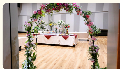
アーチフラワー 176,000円(税込)