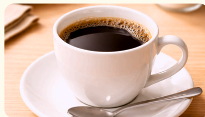
コーヒー/紅茶 カップソーサー 550円(税込)/1杯 ※50杯以上より