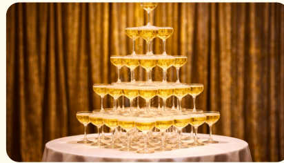
シャンパンタワー 66,000円(税込) ※ドリンク別