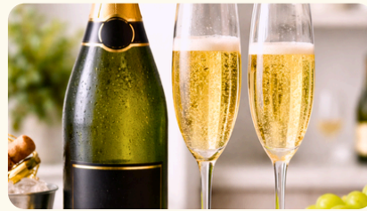
スパークリングワイン 4,400円(税込)/本