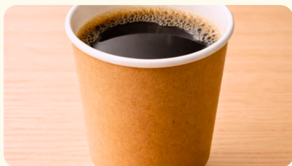
コーヒー/紅茶 使い捨てカップ 330円(税込)/1杯 ※50杯以上より