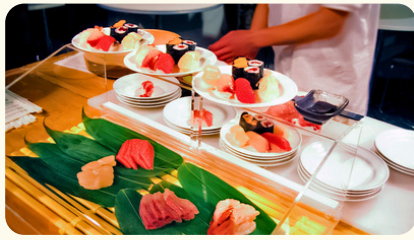
出張板前握り寿司 2,420円(税込)/1名 ※50名分以上より

1か月前までにご注文をお願いいたします。 別途諸経費(人件費/配送費/備品費)が発生する場合がございます。 オプションによって最少発注金額が異なります。また、掲載の無い商品やサービスもご用意可能です。詳しくはお問い合わせくださいませ。