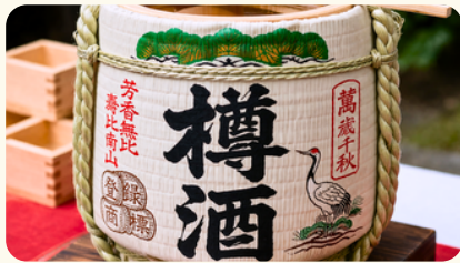
樽酒 4斗樽1斗酒入り 165,000円(税込)