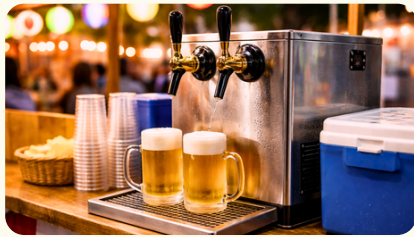
ビールサーバー ビール樽10ℓ付き 16,500円(税込)