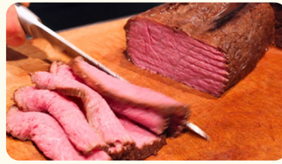
国産牛ローストビーフ 現地カッティング 2,420円(税込)/1名 ※50名分以上より