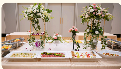
ビュッフェ卓用 生花 99,000円(税込)~